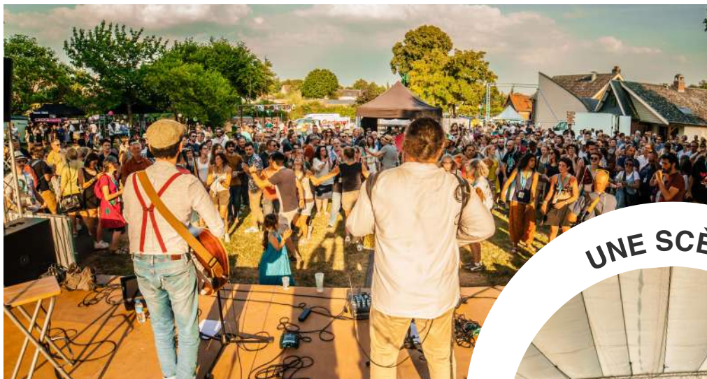
UNE SCÈNE FOLK