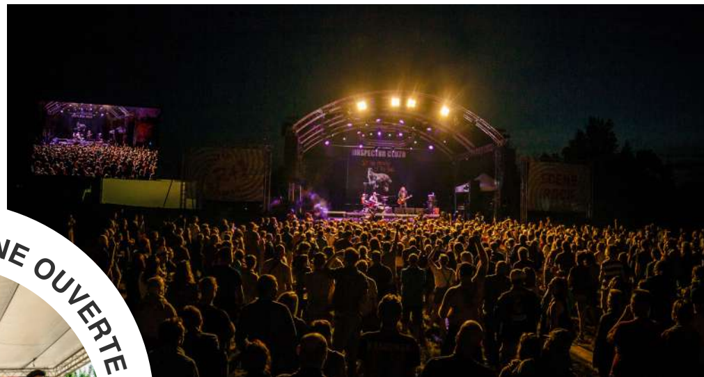
UNE SCÈNE ROCK