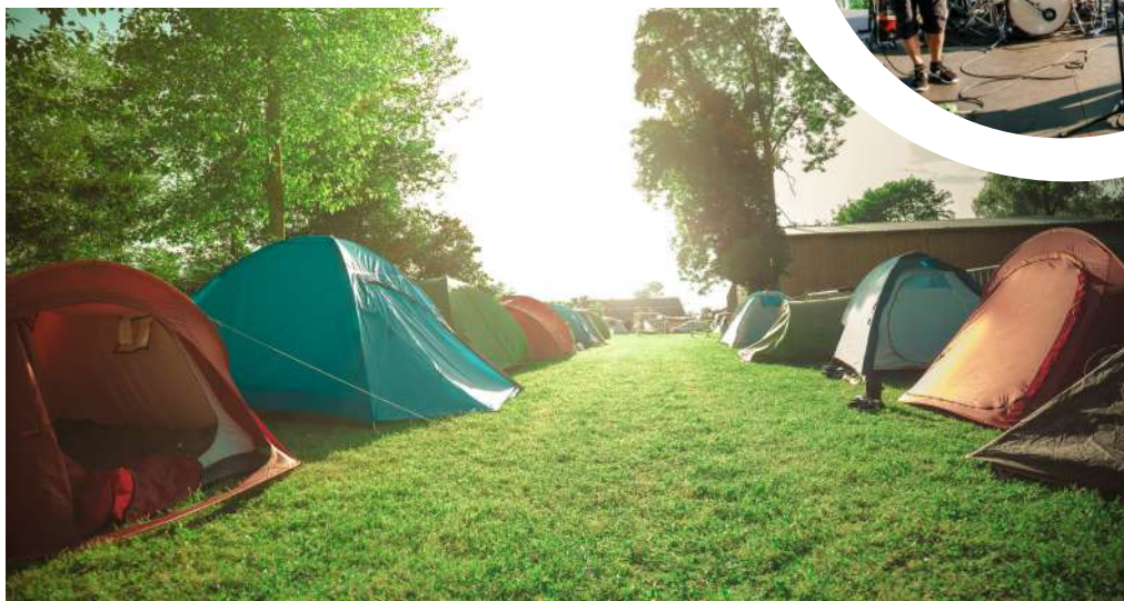
UNE AIRE DE CAMPING